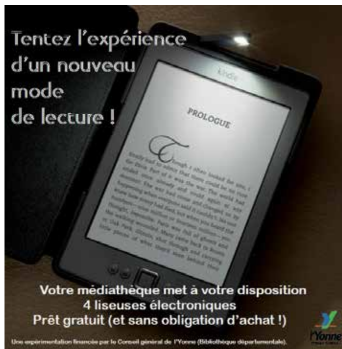
Affiche réalisée par la bibliothèque de Paron

Les usagers sont quasi-unanimes, y compris ceux qui déclarent un fort attachement pour le livre papier, pour mettre en avant les avantages indéniables des liseuses. Elles sont légères, pratiques à emporter avec soi n'importe où, et offrent un confort de lecture aussi agréable qu'un livre papier. Les nouvelles liseuses (sorties à l'automne 2012) sont équipées d'un système de rétroéclairage qui