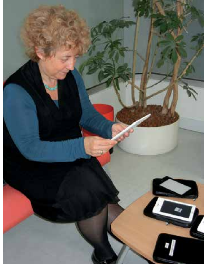
Prêt de valise numérique à la bibliothèque de Monéteau

En avril-mai, les valises numériques sont parties séduire d'autres lecteurs dans cinq nouvelles bibliothèques (Charbuy, Chevannes, Cravant, Monéteau, Thorigny-sur-Oreuse). Une nouvelle liseuse a rejoint chaque valise : la Kindle Paperwhite (Amazon), liseuse rétroéclairée, com-