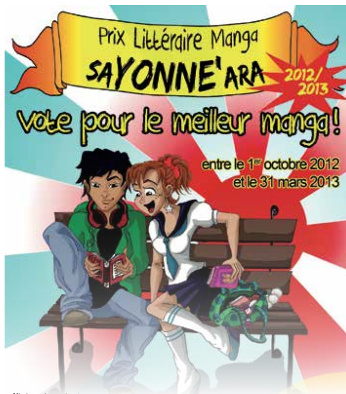
Affiche du prix SaYonne'Ara 2012-2013