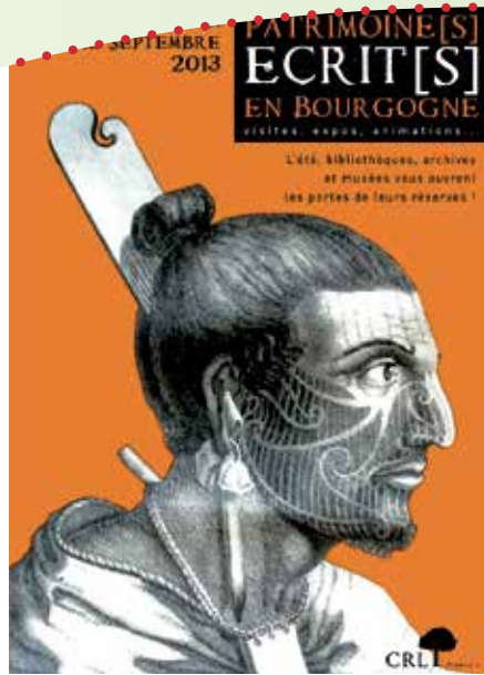
Affiche du Patrimoine écrit en Bourgogne

garo. D'autres apéro-concerts sont prévus à l'automne : le 12 octobre à Bléneau et le 18 octobre à Cravant.